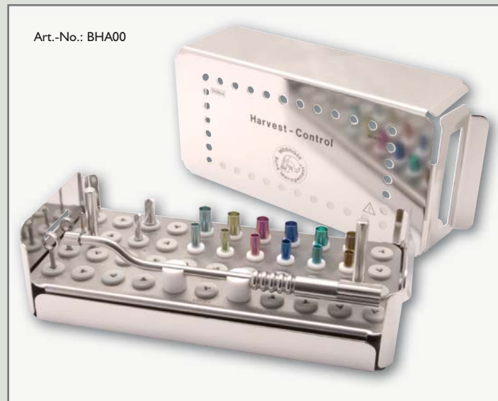
Bone Management® is a registered trademark of the Hager & Meisinger GmbH, Germany