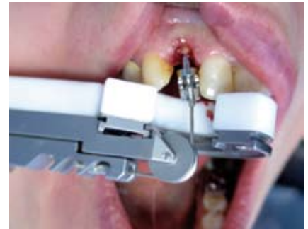
Das Zugseil wird in die Extraktorschraube eingehakt, über die Umlenkrolle das Extraktors geführt und am Haken des Extraktorschlittens eingehängt