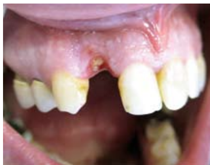
Kronenfraktur beim Extraktionsversuch

Bei dem Vorliegen dieses großen Hart- und Weichgewebeverlustes wäre klassischer Weise eine Augmentation indiziert gewe-