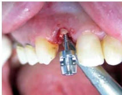
Die Extraktionsschraube wird mit dem passenden Imbusschlüssel vorsichtig eingedreht. Die Spiralbohrer und die Extraktionsschrauben gibt es in verschiedenen Längen und Durchmessern.