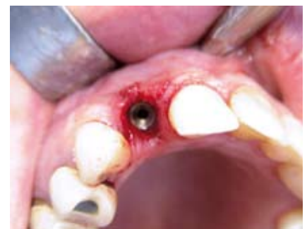
Sofortimplantation mit einem semados RI-Implantat.