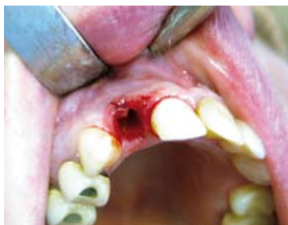
Alveole nach schonender Extraktion