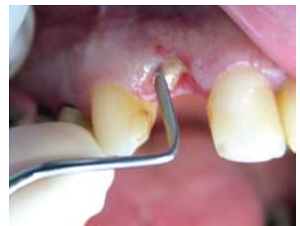
Mit Hilfe von Periotomen wird das Parodontium gelöst