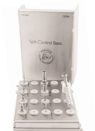
CSPBA Split Control Basic

Split-Control Basic est un système pour une augmentation de crête alvéolaire tout en douceur, ainsi qu'une condensation simultanée de l'os latéral, en cas de déficit osseux horizontal. A l'aide d'instruments de condensation (écarteurs-condenseurs, de type vis), il est possible de réaliser une dilatation douce et contrôlée de l'os résorbé horizontalement. De plus, l'os spongieux est condensé en raison de la forme particulière des écarteurs, de telle sorte que la stabilité primaire de l'implant inséré s'en trouve améliorée.